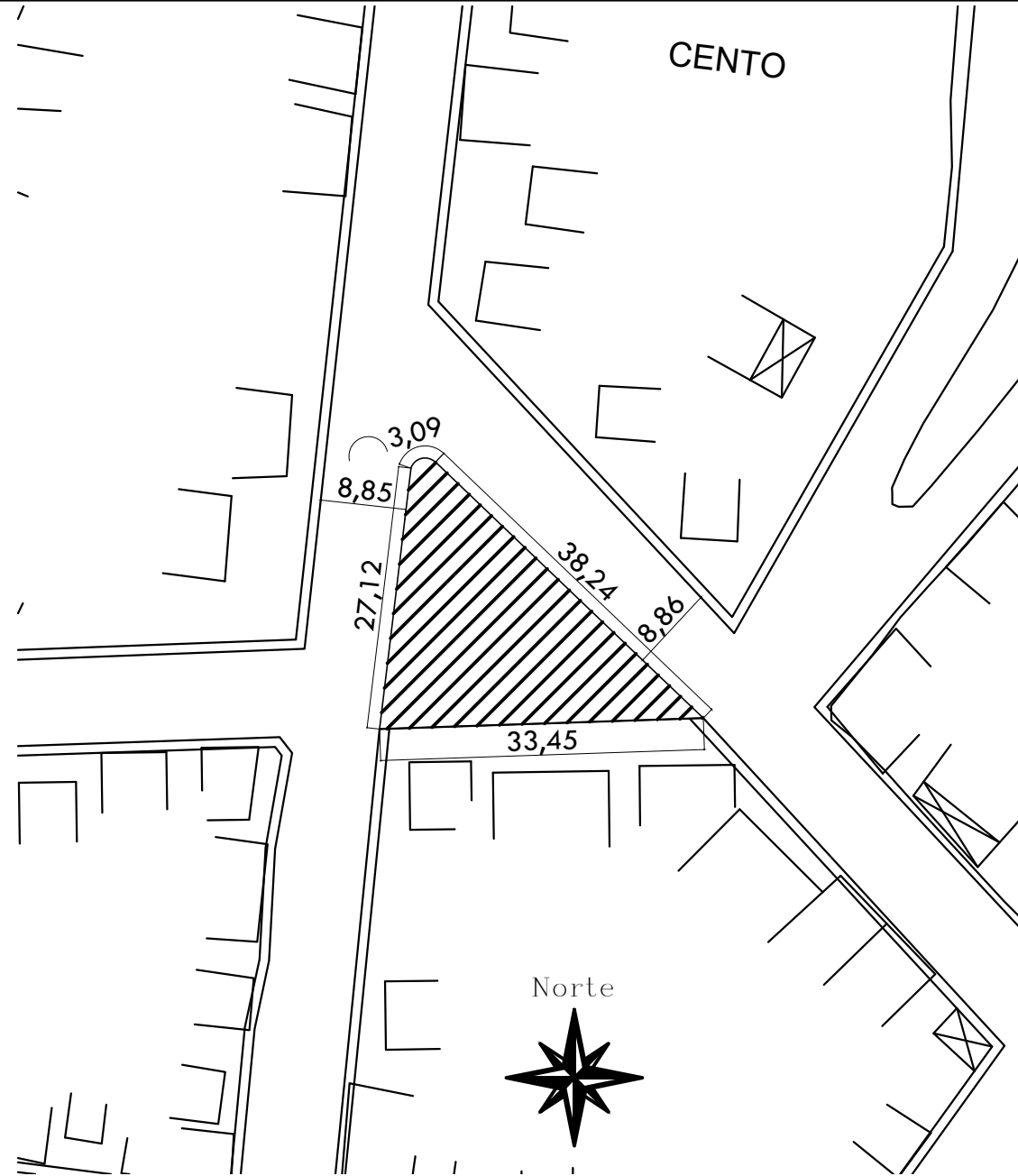
PLANTA DE SITUAÇÃO ESCALA 1/700